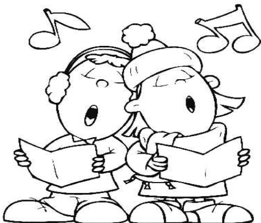
КАРИКА ЗА ОЦВЕТАВАНЕ

Ако сте работили вярно, отвесно ще получите название на любим празник.